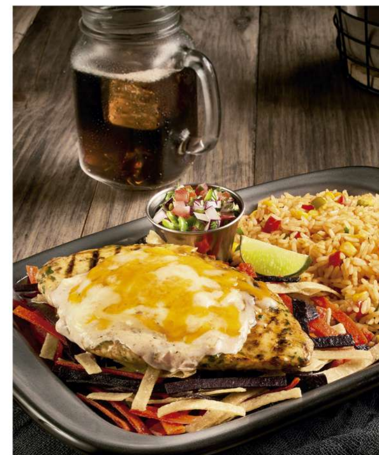
FIESTA LIME CHICKEN

Applebee's no puede asegurar que nuestro menú no contenga ingredientes que puedan causar una reacción alérgica o tener un impacto negativo en otras restricciones de dieta. La información de alérgenos se encuentra disponible para usted si la requiere. Adicionalmente, algunos de nuestros platillos pueden contener alcohol. Las imágenes de los alimentos, bebidas y utensilios son de carácter ilustrativo. © 2023 Applebee's Restaurants LLC.