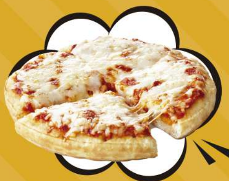
PIZZA DE QUESO