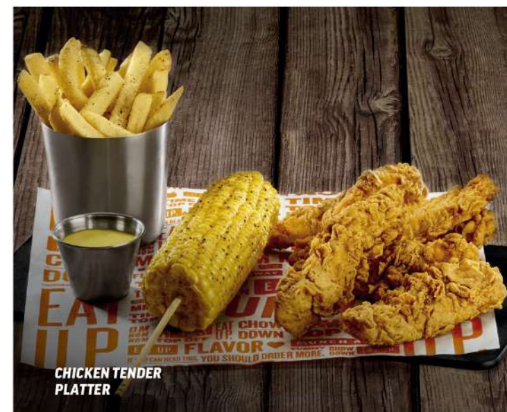
CHICKEN TENDER PLATTER