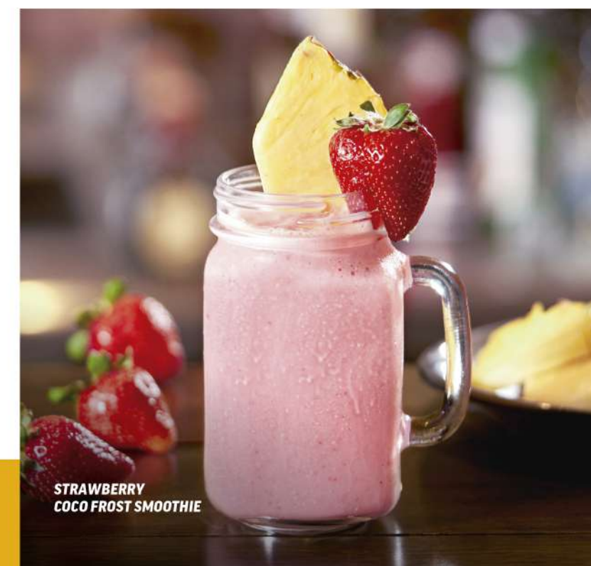
STRAWBERRY COCO FROST SMOOTHIE