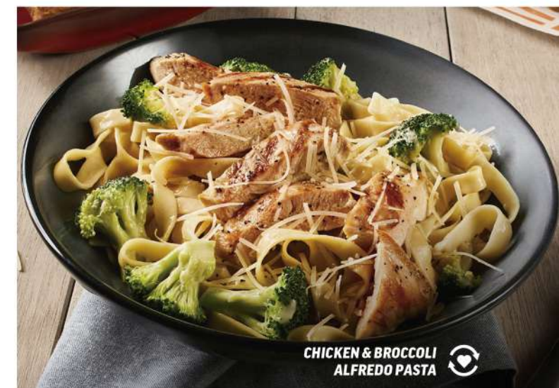
CHICKEN & BROCCOLI ALFREDO PASTA