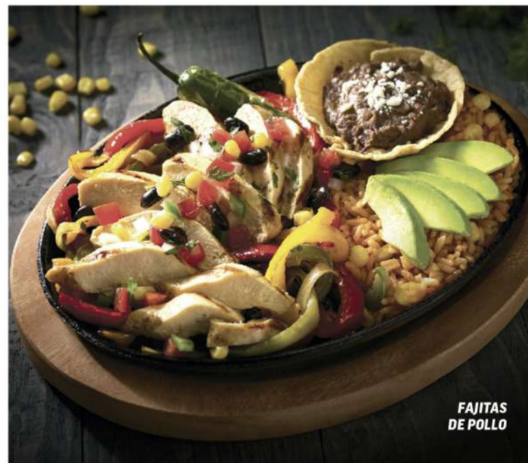
FAJITAS DE POLLO