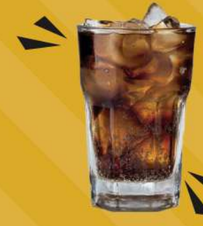
REFRESCO 295 ml