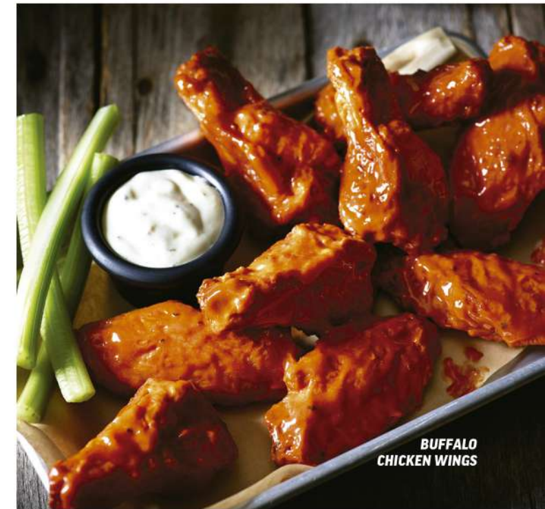
BUFFALO CHICKEN WINGS