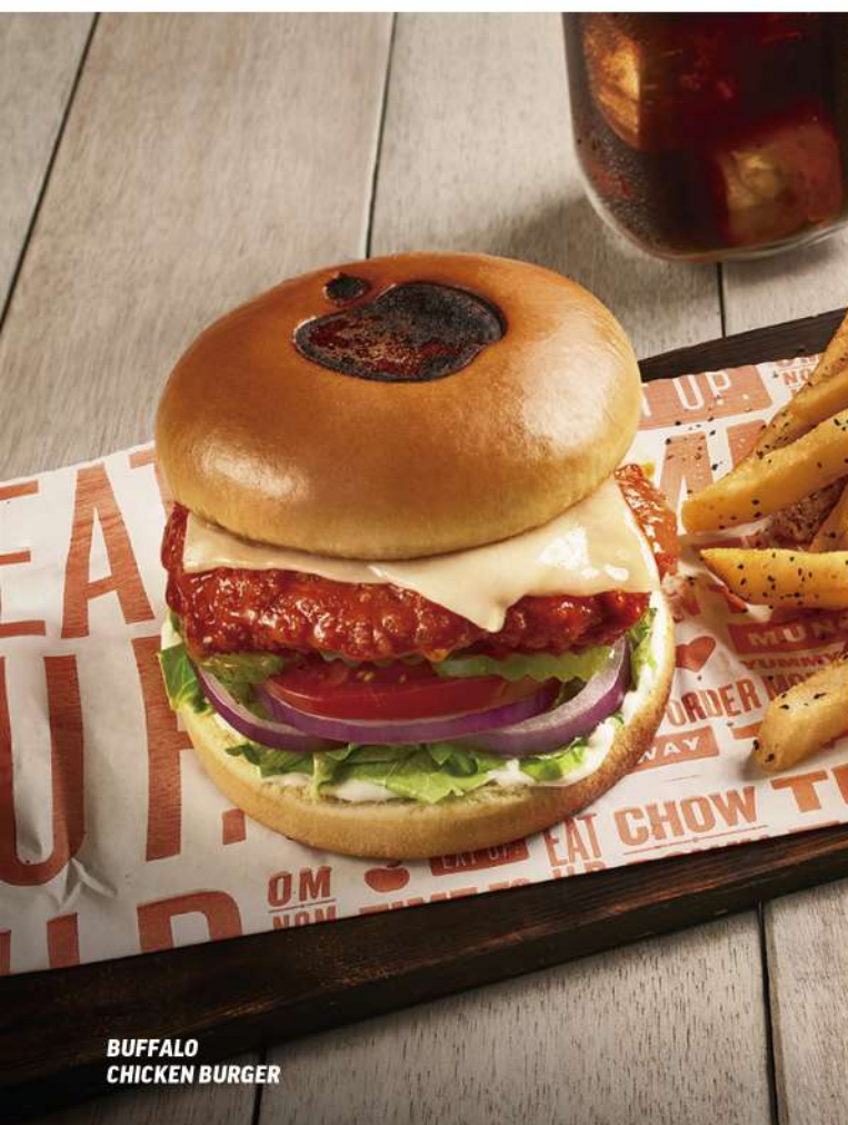
BUFFALO CHICKEN BURGER