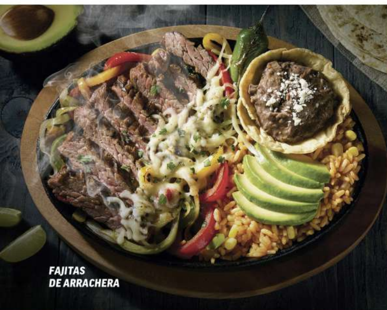
FAJITAS DE ARRACHERA