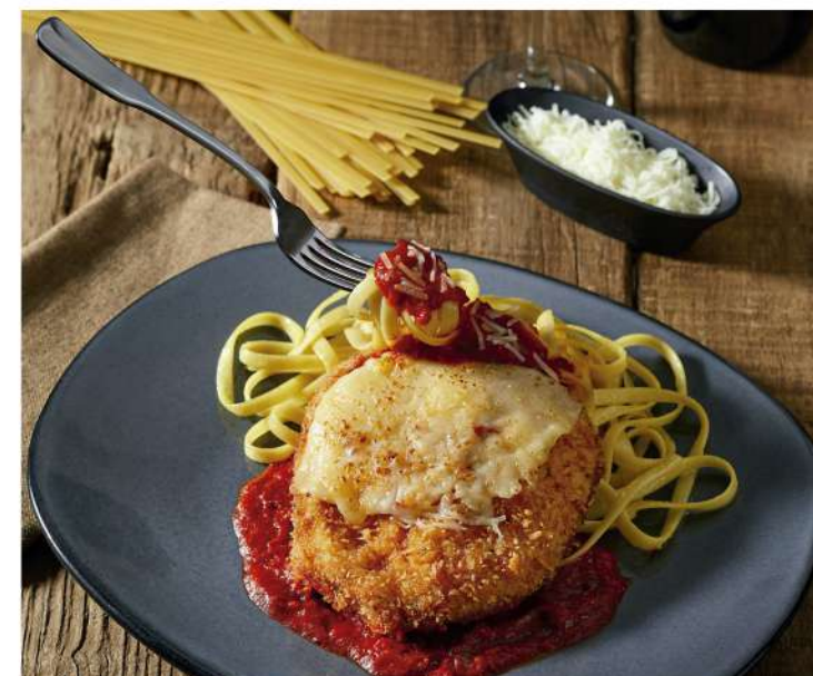
CHICKEN PARMIGIANA PASTA