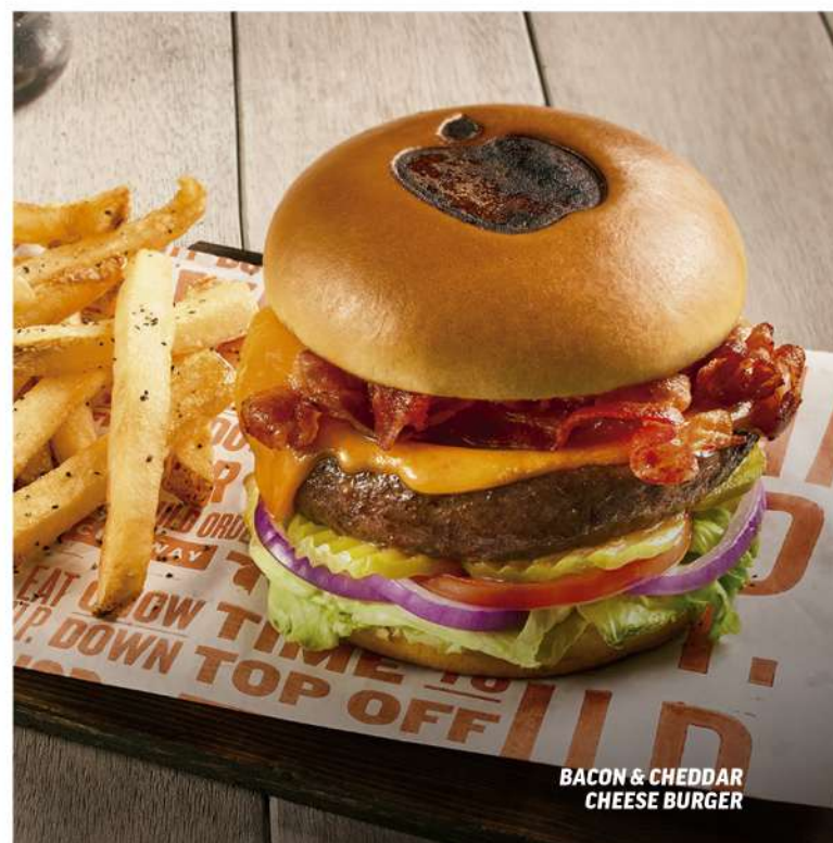
BACON & CHEDDAR CHEESE BURGER