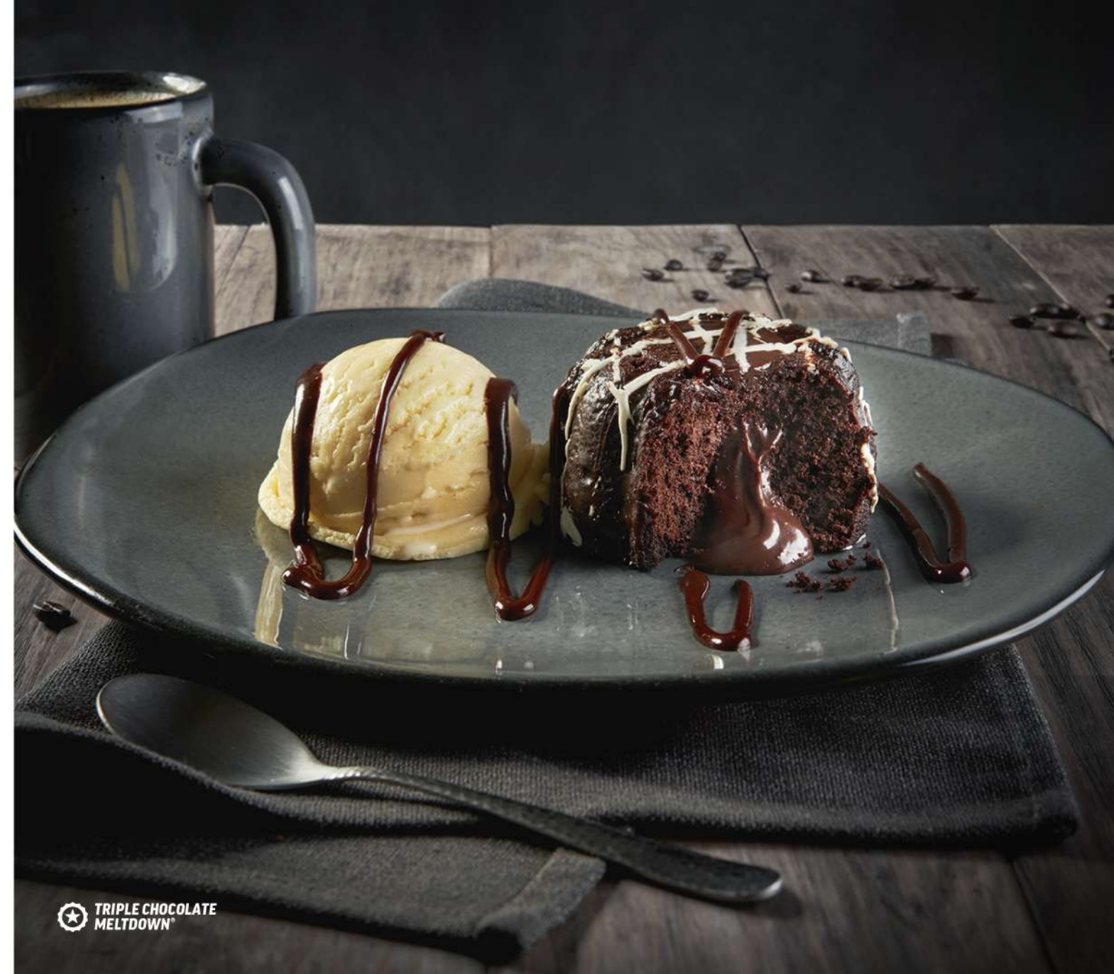
TRIPLE CHOCOLATE MELTDOWN*

LA CELEBRACIÓN NO SE TERMINA SI NO HAY POSTRE