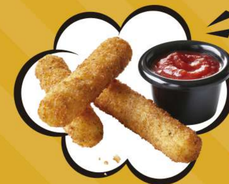
DEDOS DE QUESO