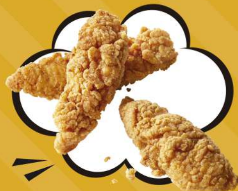
TIRAS DE POLLO