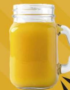
NARANJADA 295 ml