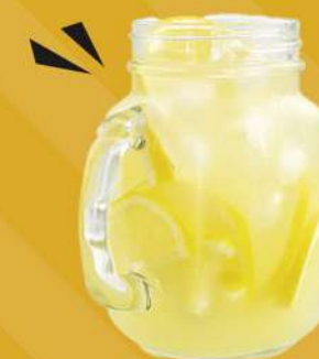
LIMONADA 295 ml