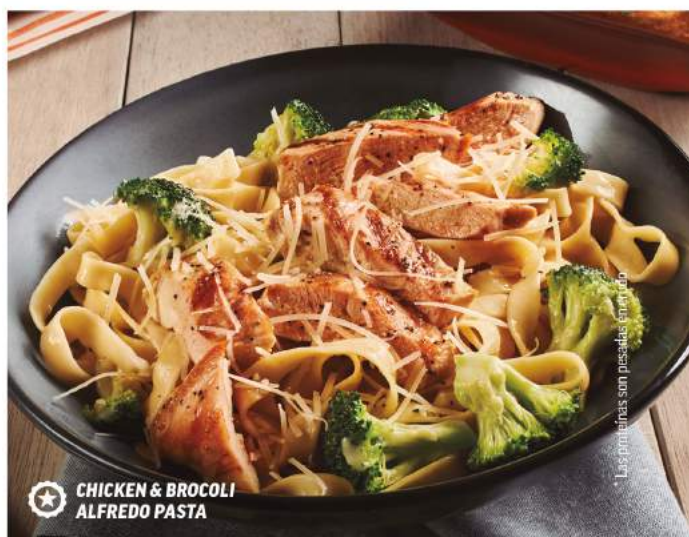
CHICKEN & BROCOLI ALFREDO PASTA

Applebee's no puede asegurar que nuestro menú no contenga ingredientes que puedan causar una reacción alérgica o tener un impacto negativo en otras restricciones de dieta. La información alérgica se encuentra disponible para usted si la requiere. Solo en restaurantes participantes. No aplica con otras promociones y/o descuentos. Todos nuestros precios incluyen IVA. Régimen de excepción para entrega a domicilio, ya que pueden aplicar cargos extras. Nuestras formas de pago son tarjeta de débito o crédito y efectivo. En el caso de promociones el pago deberá de ser con tarjeta de débito o crédito. La propina no es obligatoria. COME BIEN. © 2022 Applebee's Restaurants LLC. Las imágenes son solo de carácter ilustrativo.