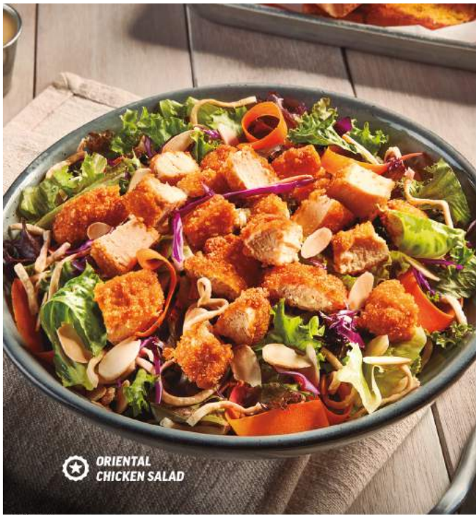
ORIENTAL CHICKEN SALAD