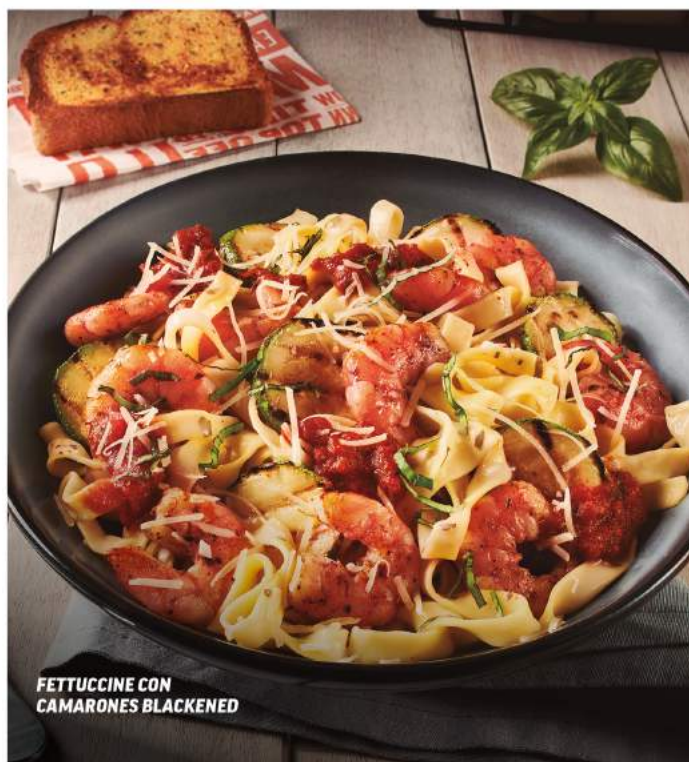
FETTUCCINE CON CAMARONES BLACKENED