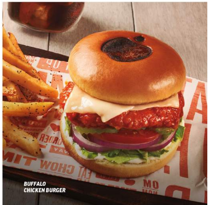
BUFFALO CHICKEN BURGER