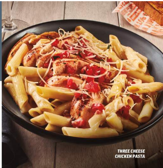
THREE CHEESE CHICKEN PASTA