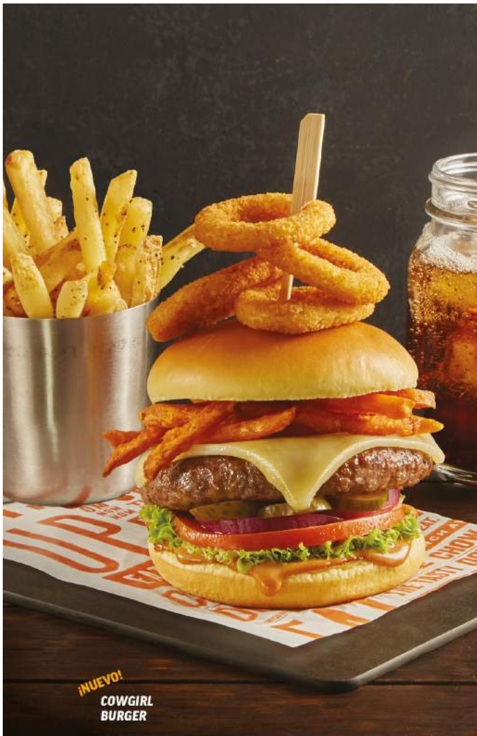
¡NUEVO! COWGIRL BURGER