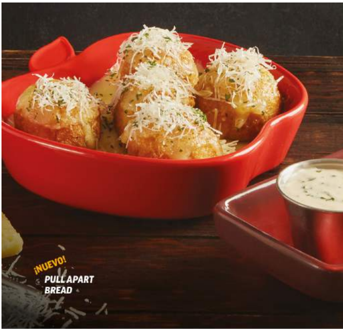
¡NUEVO! PULL APART BREAD