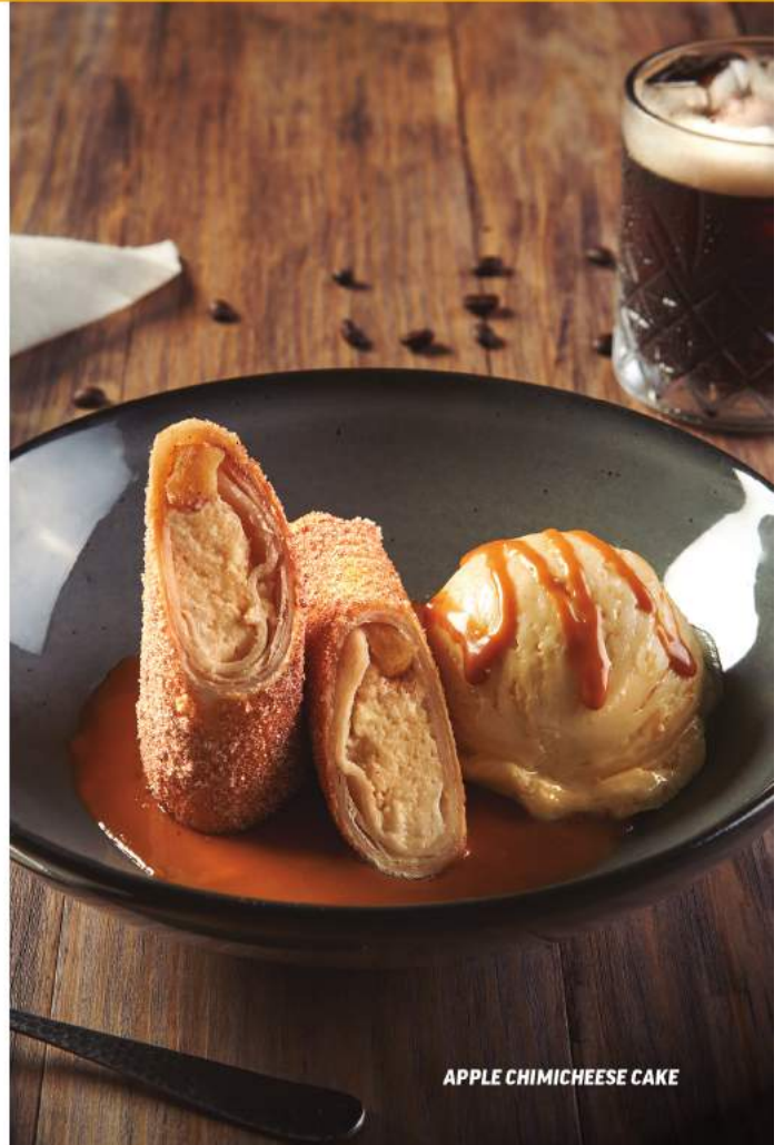
APPLE CHIMICHEESE CAKE

Applebee's no puede asegurar que nuestro menú no contenga ingredientes que puedan causar una reacción alérgica o tener un impacto negativo en otras restricciones de dieta. La información alérgica se encuentra disponible para usted si la requiere. Solo en restaurantes participantes. No aplica con otras promociones y/o descuentos. Todos nuestros precios incluyen IVA. Régimen de excepción para entrega a domicilio, ya que pueden aplicarse cargos extras. Nuestras formas de pago son: Tarjeta de débito o crédito y efectivo. En el caso de promociones el pago deberá de ser con tarjeta de débito o crédito. La propina no es obligatoria. COME BIEN. © 2022 Applebee's Restaurants LLC. Las imágenes son solo de carácter ilustrativo.