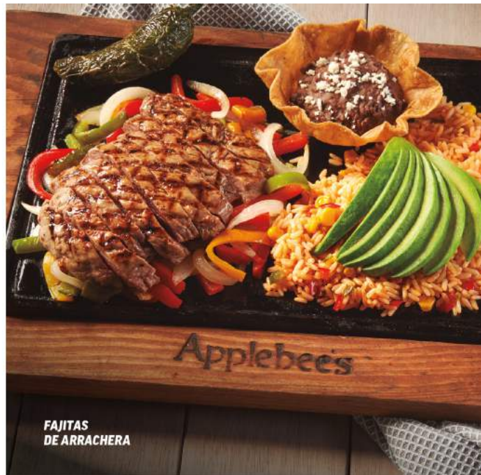
FAJITAS DE ARRACHERA