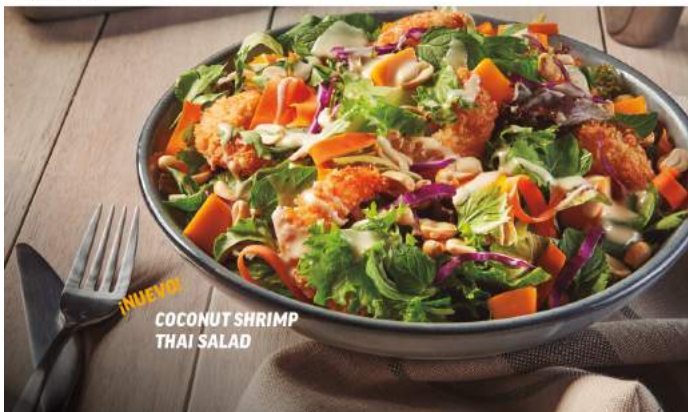
COCONUT SHRIMP THAI SALAD