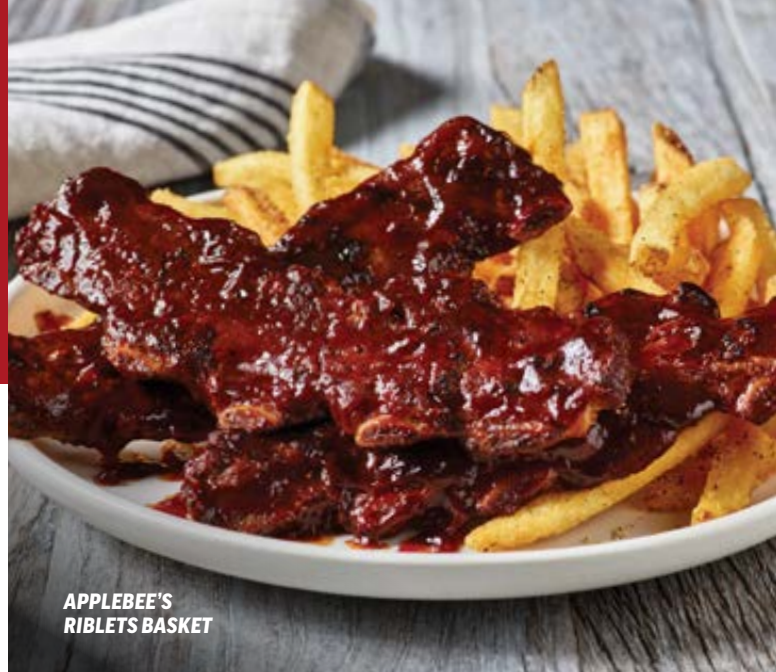
APPLEBEE'S RIBLETS BASKET