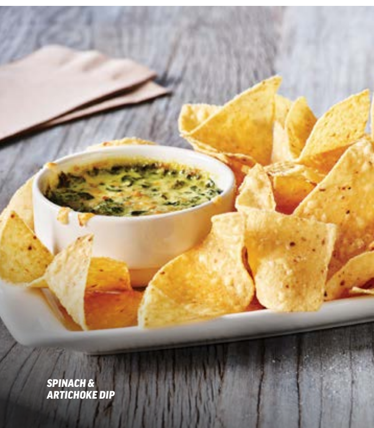
SPINACH & ARTICHOKE DIP