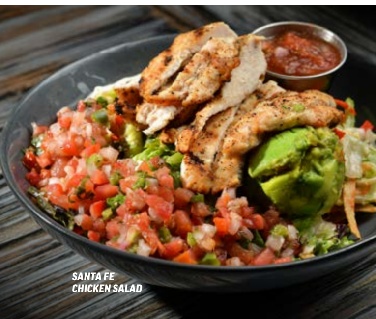
SANTA FE CHICKEN SALAD