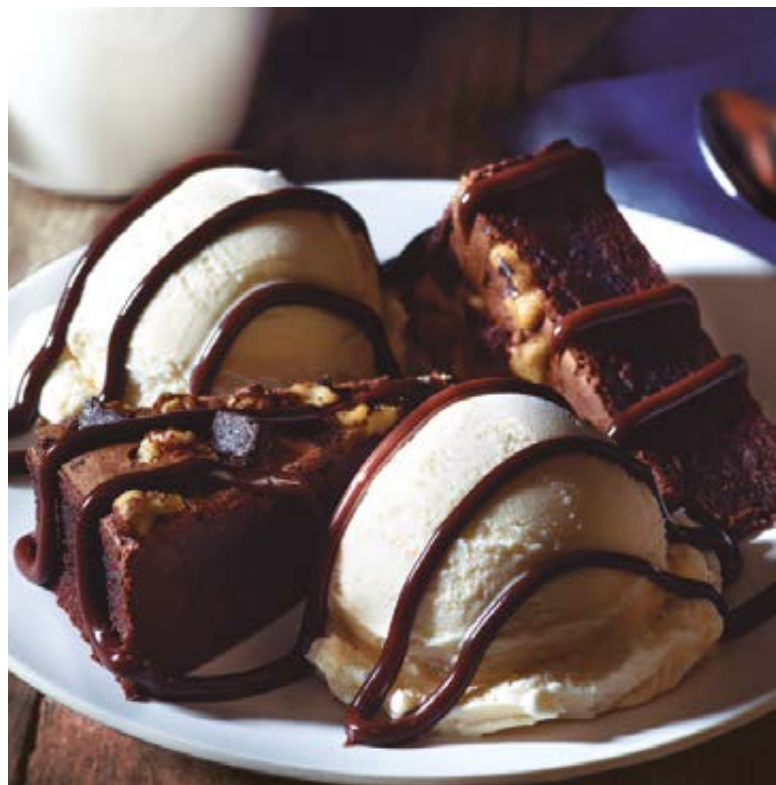
FUDGE BROWNIE SUNDAE