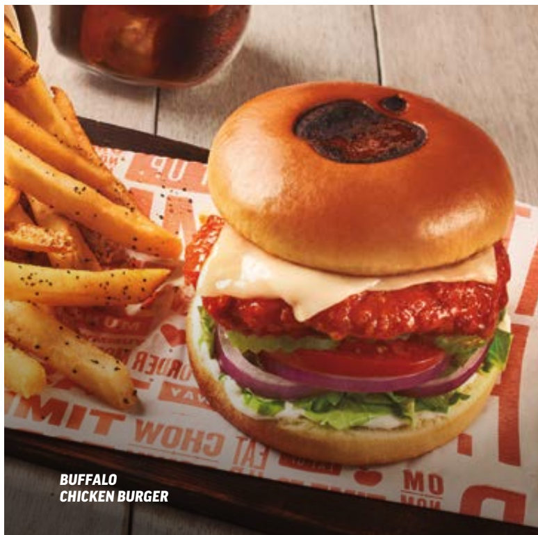
BUFFALO CHICKEN BURGER