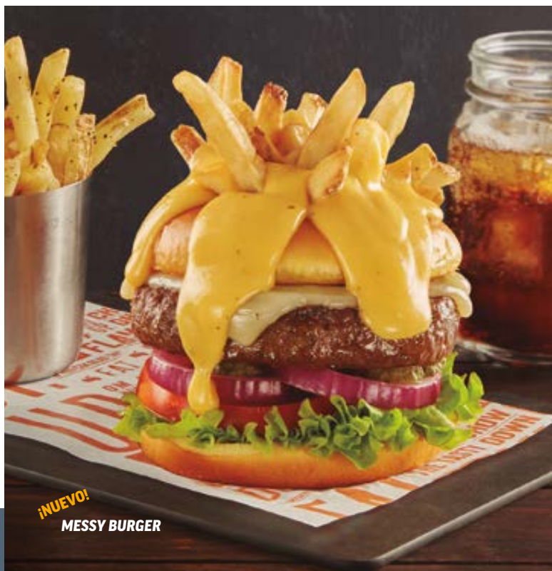
¡NUEVO! MESSY BURGER