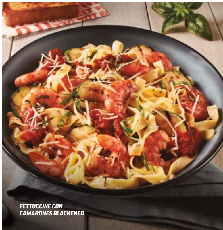
FETTUCCINE CON CAMARONES BLACKENED