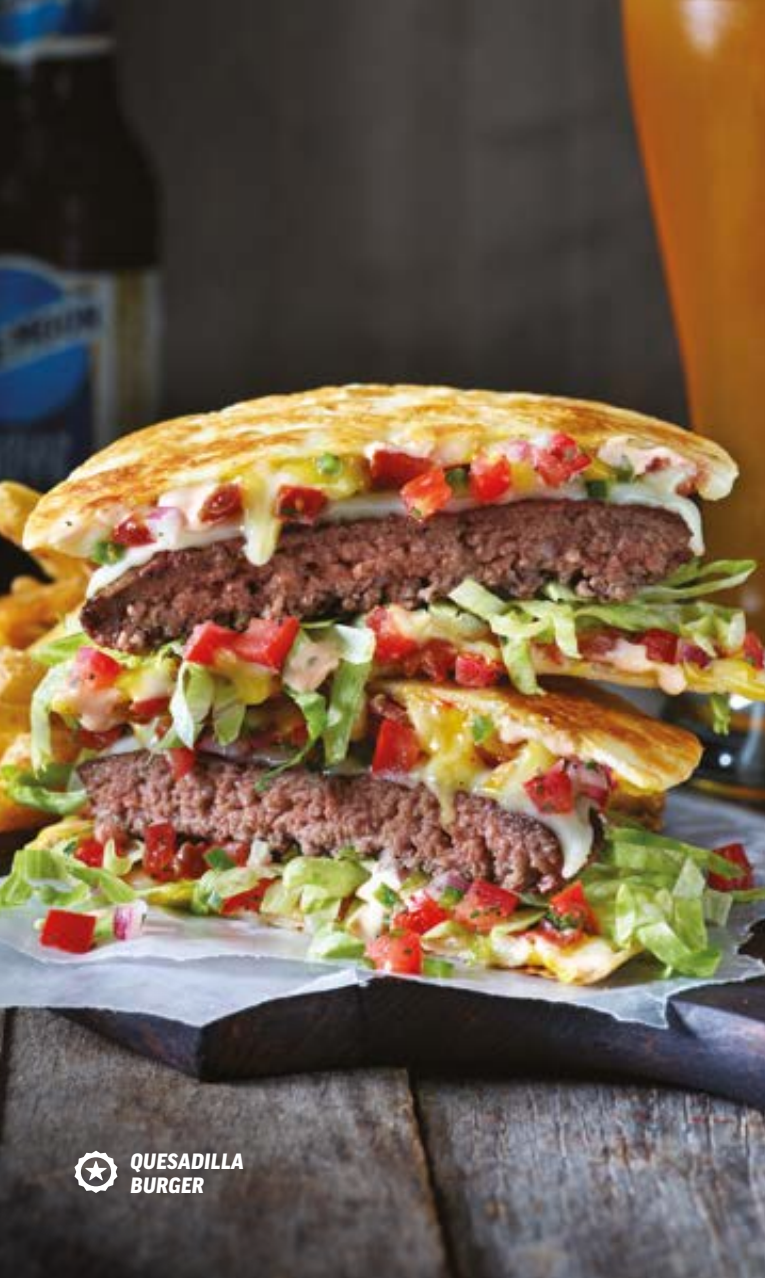
★ QUESADILLA BURGER