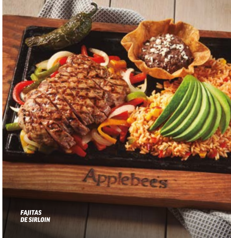
FAJITAS DE SIRLOIN