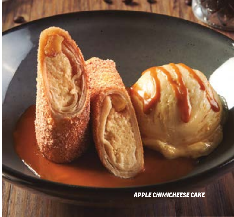
APPLE CHIMICHEESE CAKE