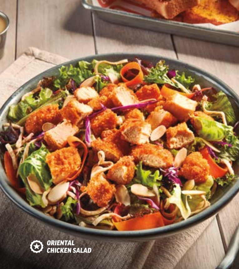
ORIENTAL CHICKEN SALAD