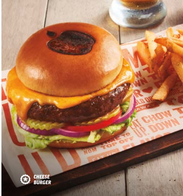
★ CHEESE BURGER