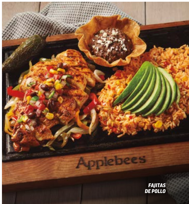
FAJITAS DE POLLO