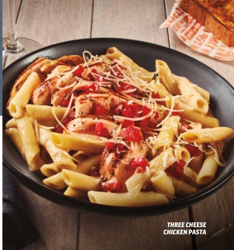
THREE CHEESE CHICKEN PASTA