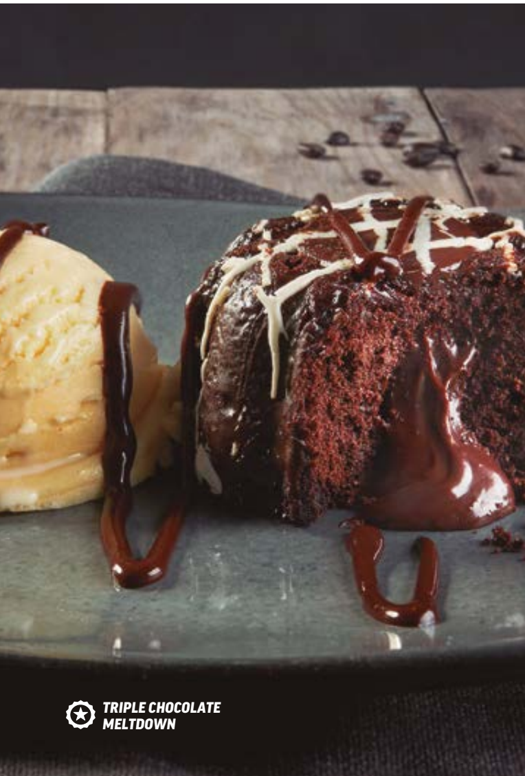
TRIPLE CHOCOLATE MELTDOWN